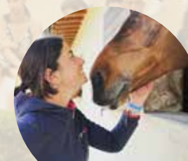
Team Selleria Equipe