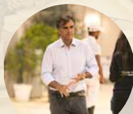
SCH Jumping team