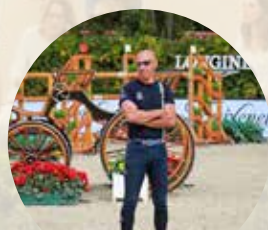
Equinet Jumping team