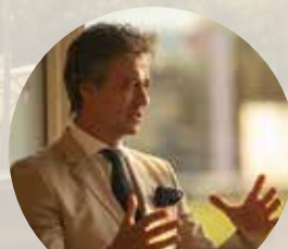
Scuderia 1918 Racing team