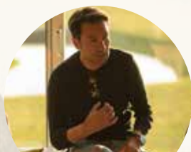
Cavalleria Toscana RG Team