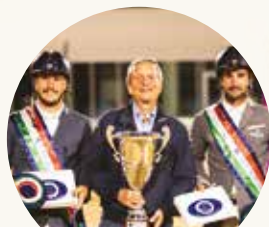
Banca del Fucino Las Helmet Team